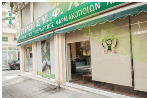
Οι εγκαταστάσεις του Προμηθευτικού Συνεταιρισμού Φαρμακοποιών Λάρισας - ΠΡΟΣΥΦΛΑ ΠΕ.

Αναζητήστε πληροφορίες στη θεματική ιστοσελίδα