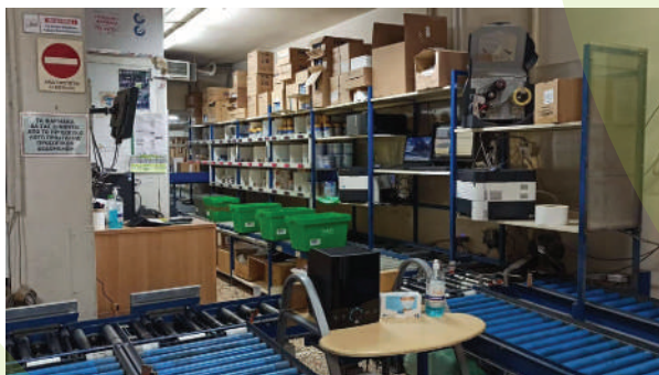
Οι εγκαταστάσεις του Συνεταιρισμού Φαρμακοποιών Λάρισας.

ξεων, τη συλλογή αρχειακού υλικού, και γενικότερα στόχος είναι στις αρχές του 2025 να έχουν ολοκληρωθεί οι εν λόγω εργασίες σε όλους τους θεσσαλικούς νομούς, αφού η ομάδα μας ήδη έχει επισκεφθεί τις εγκαταστάσεις των άλλων συνεταιρισμών της Θεσσαλίας.